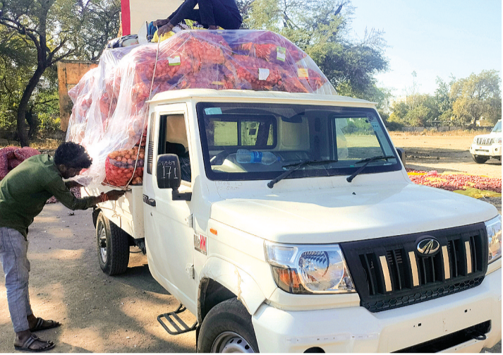
हरिभूमि न्यूज़ ▶▶ ब्यावरा-सारंगपुर

एक तरफ किसानों को अपनी फसलों के उचित दाम तक नहीं मिल पा रहे, वहीं दूसरी ओर कृषि मंडी सारंगपुर के व्यापारी मंडी टेक्स बचाकर और सरकार को चूना लगाकर अपनी आय बढ़ाने में लगे हुए हैं। हालात यह है कि प्याज व लहसुन को सबसे ज्यादा आवक वाली मंडी को ग्रहण लगाया जा रहा है और वो भी अधिकारियों की नाक के नीचे। कृषि उपज मंडी सारंगपुर से बिना अनुज्ञा (परमिट) के लाखों रुपए की प्याज की सप्लाई किए जाने का मामला सामने आया