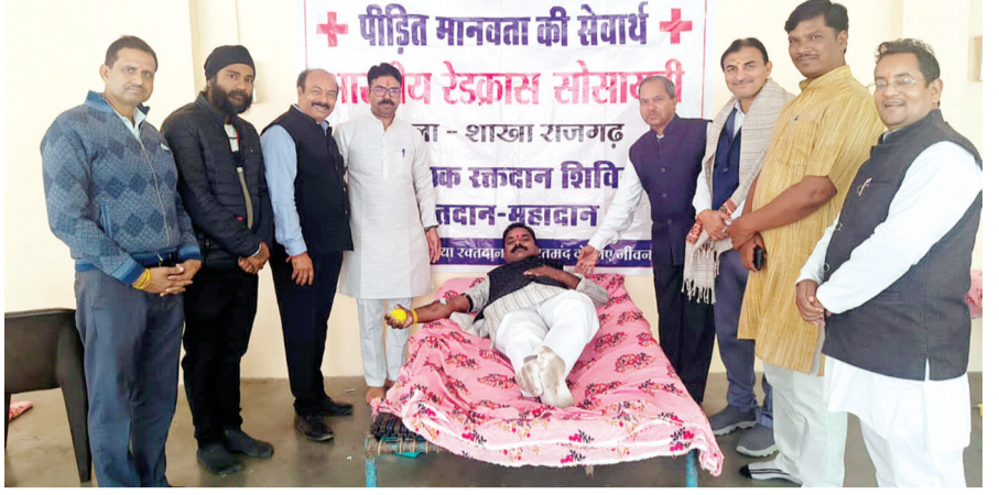
हरिभूमि न्यूज़ ▶▶ ब्यावरा