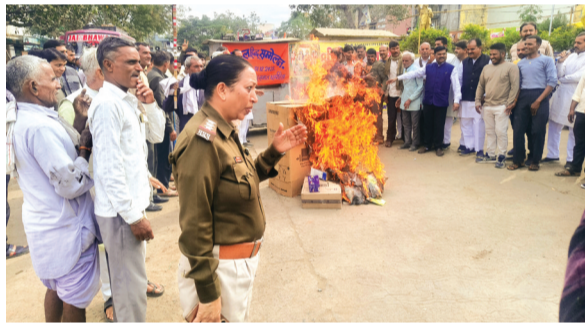
हरिभूमि न्यूज़ ▶▶ छापीहेड़ा

नगर के सभी शासकीय अशासकीय विद्यालय ने पंच परिवर्तन एवं स्वदेशी जागरण निषेध को लेकर मानव श्रृंखला जो नगर के एक छोर रनारा जोड़ चौराहा से लेकर दूसरे छोर कृषि उपज मंडी गेट तक बनाई। नगर के सभी विद्यालय सरस्वती शिशु मंदिर कृष्ण वैली स्कूल सरस्वती ज्ञान मंदिर प्रखर कॉन्वेंट स्कूल रविंद्र कान्वेंट स्कूल जय हिंद अकैडमी कन्या उच्चतर माध्यमिक विद्यालय बालक उच्चतर माध्यमिक विद्यालय के छात्र एवं छात्राओं ने भाग लेकर स्वदेशी अपनाओ विदेशी हटाओ अपने देश में बनी चीजों का इस्तेमाल करो और विदेशी उत्पादों का बहिष्कार करो जो भारत में आत्मनिर्भरता और स्थानीय उद्योगों को बढ़ावा देने के लिए एक राष्ट्रीय आह्वान है जो आर्थिक स्वतंत्रता एवं रोजगार सृजन और राष्ट्रवाद की भावना मन में जगृत करता है छापीहेड़ा बस