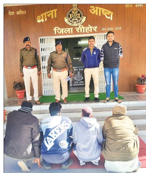
हरिभूमि न्यूज | आष्टा

सर्व हिंदू समाज के अल्टीमेटम के बाद पुलिस ने वीडियो फुटेज का सहारा लेकर मुख्य उपद्रवियों को किया चिन्हित।