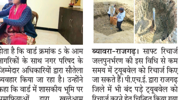
हरिभूमि न्यूज़ ▶▶ ब्यावरा-राजगढ़

साफ्ट रिचार्ज जलपुनर्भरण की इस विधि से कम समय में ट्यूबवेल को रिचार्ज किए जा सकते हैं। पी.एच.ई. द्वारा राजगढ़ जिले में भी बंद पड़े ट्यूबवेल को रिचार्ज करने हेतु चिन्हित किया गया है। कलेक्टर डॉ. गिरीश कुमार मिश्रा द्वारा उक्त चिन्हित ट्यूबवेल को रिचार्ज करने का कार्य पंचायतों द्वारा किया जाने हेतु निर्देशित किया गया है। अभी सभी जनपद पंचायतों में 10-10 कार्य प्रारंभ किए जा रहे हैं। पूर्व वर्षों में भी इस तरह के पुनर्भरण के कार्य किए गए हैं। जिससे वाटर लेवल बढ़ा है। जनपद पंचायतों में पदस्थ अभियंताओं द्वारा अपनी देखरेख में उक्त कार्य कराए जा रहे हैं। जिससे आगामी वर्षा ऋतु में वाटर लेवल बढ़ेगा।